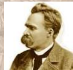
(Friedrich Nietzsche, filozof)