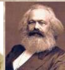
(Karol Marx, filozof)