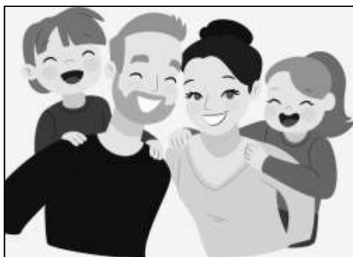
ŠTYRI rôzne osoby, ale len JEDNA rodina.

Ako to pochopiť? No, nie je to zase až tak úplne zvláštne. Niečo podobné existuje aj tu, na zemi, v našom svete: